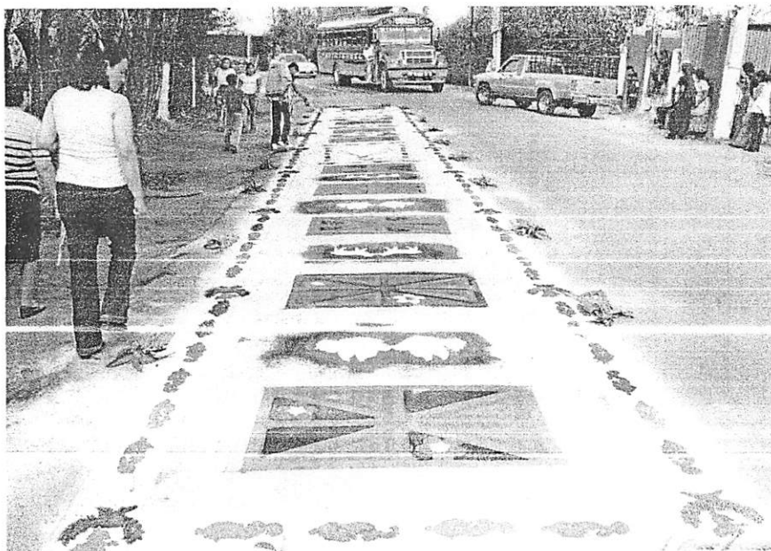
Alfombra para una Procesión de Semana Santa

Aparte de la Actividades de educación continua la Casa de la Cultura actualmente es la encargada de organiza muchos eventos de la Feria Titular, el 23 de enero en donde se celebra en honor a el patrono San Raymundo de Peñafort, lo cual tiene una duración aproximada de un mes. Dicha entidad organiza muchos eventos incluyendo lo que es el Baile Antañón, ya que se quiere seguir conservando el valor.